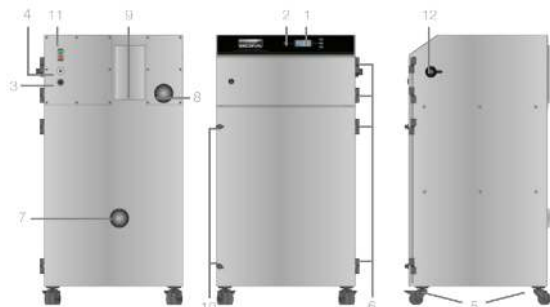
Внешний вид дымоуловителя AD PVC