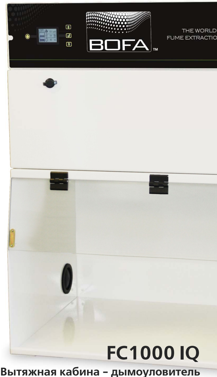
FC1000 IQ Вытяжная кабина - дымоуловитель